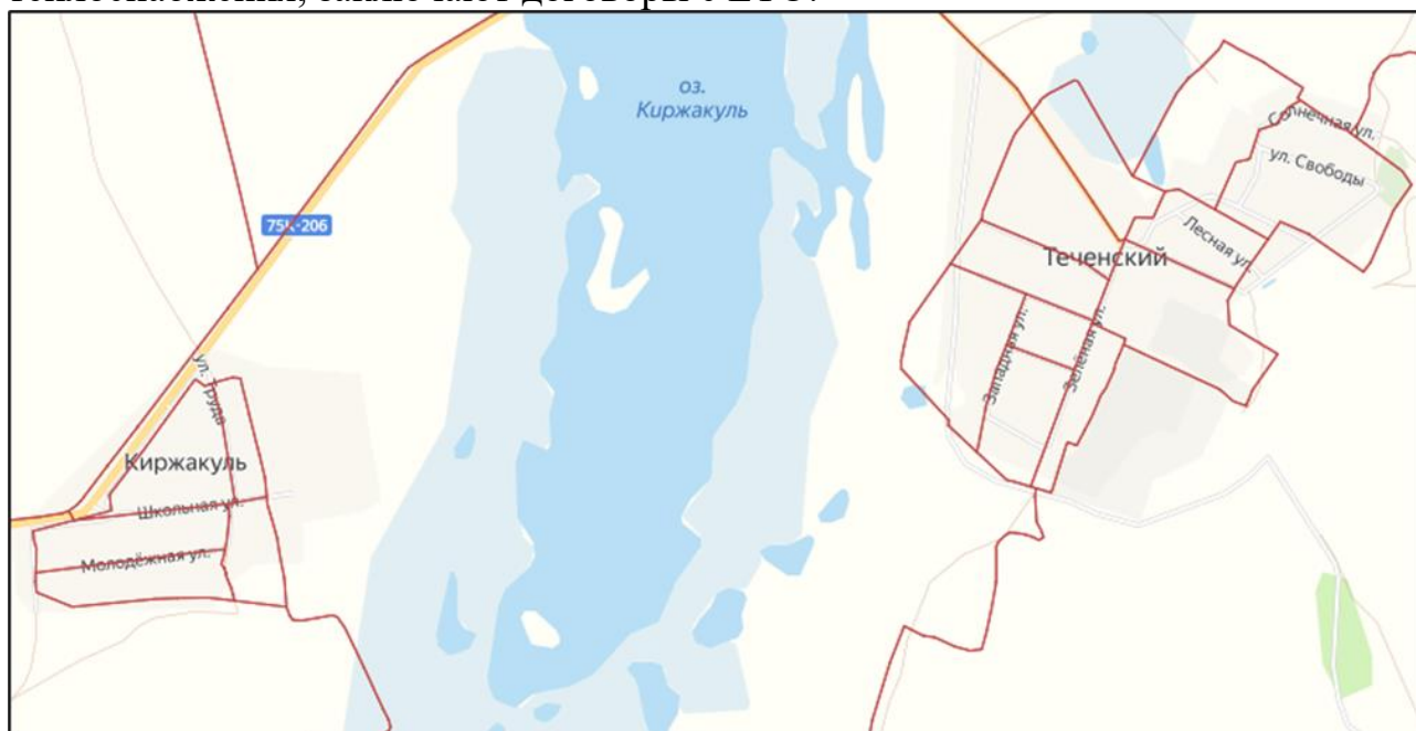
Рисунок 1.1.1.2. Кадастровое деление сельского поселения

деятельности ЕТО независимо от точки подключения и источника теплоснабжения, заключают договоры с ЕТО.